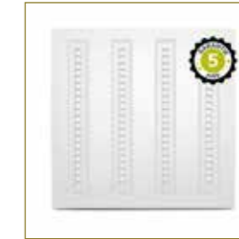
LED-PANEEL-WIT-595x595 ref: 100748

Nauwkeurige en comfortabele verlichting voor taken die concentratie vereisen. De verlichting verblindt niet en zorgt voor een goed visueel comfort in het dagelijks leven.