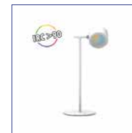
BUREAULAMP ROND WIT ref: 100863