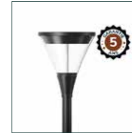
LANTAARN LED ZWART ref: 100856