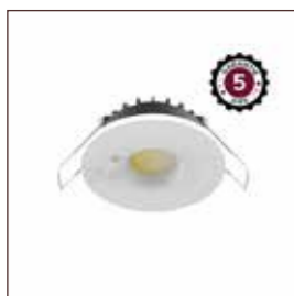
DOWNLIGHT-SPOT ESA ref: 100619

Gelijkmatige en onopvallende verlichting voor een schone en veilige ruimte. Automatische detectie voor meer hygiëne en besparingen.