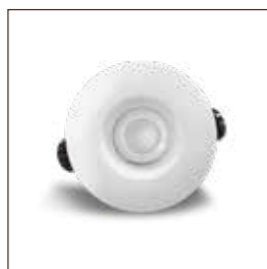
HECTOR-SPOT ref: DL06HEC01CCT