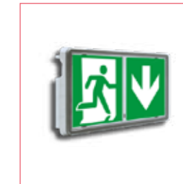
BLOC TECH EMERGENCY ref: BTONEE1S65DUOBE