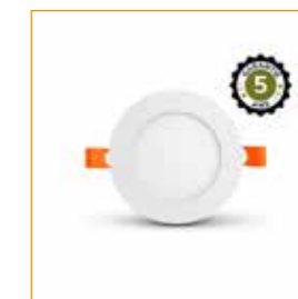
INBOUW-LED-ROND ref: 100033

Gezellige verlichting om de ruimte tot zijn recht te laten komen en bezoekers de weg te wijzen. Een verzorgde verlichting zorgt voor een positieve eerste indruk.