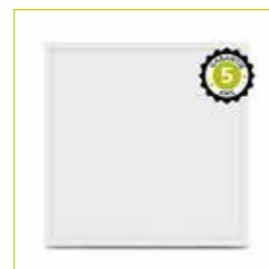
LED-PANEL-WHITE ref: 7770B

Gelijkmatige, niet-verblindende verlichting voor een optimaal zicht. Het neutrale licht bevordert de concentratie en vermindert oogvermoeidheid.