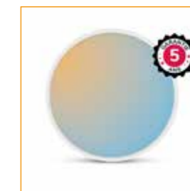
LED HUBLOT LUNA II ref: 100746