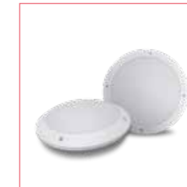
LED HUBLOT TRIPTIK ref: HUB22TRK01CCTE

Constante verlichting voor een veilige doorgang. Ook bij noodtoestand.