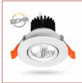
DOWNLIGHT-SPOT ref: 100397

Een zacht en warm licht voor een gezellige sfeer. Het laat de kleuren van de gerechten goed tot hun recht komen en bevordert de ontspanning.