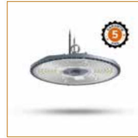
LED Highbay LUNAR réf: 100798

Éclairage puissant et homogène pour une pratique sportive en toute sécurité. Luminaires robustes, résistants aux chocs et aux impacts.