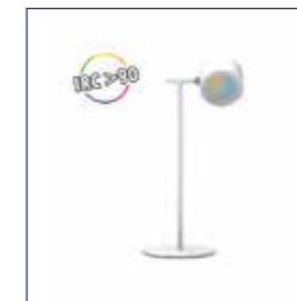
LAMPE DE BUREAU RONDE BLANCHE réf: 100863