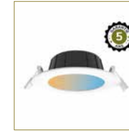
DOWNLIGHT LED CYNIUS réf: 100652