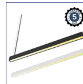
LED LINÉAIRE PRISMATIQUE Blanc réf. : 100696 Noir réf. : 100695

Lumière douce et homogène pour lire ou travailler en toute tranquillité. Des éclairages d'appoint offrent un confort personnalisé.