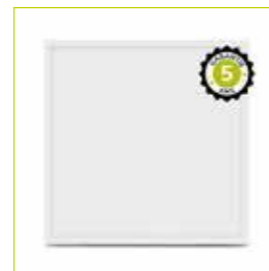
PANNEAU LED BLANC réf: 7770B

Éclairage uniforme et sans éblouissement pour une visibilité optimale. La lumière neutre favorise la concentration et réduit la fatigue visuelle.