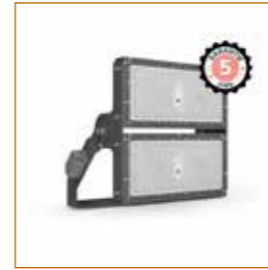
PROJECTEUR LED 500W réf: 100923