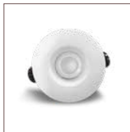
SPOT HECTOR réf: DL06HEC01CCT