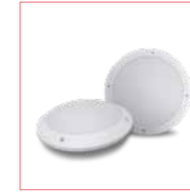
HUBLOT LED TRIPTIK réf: HUB22TRK01CCTE

Un éclairage constant pour un passage en toute sécurité. Même en cas d'urgence.