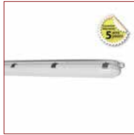
TRIPROOF 150CM - réf: 75812