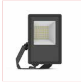
LUMOS LITE réf: 100739

Une lumière robuste et directionnelle sécurise les abords de l'école. Résistante à la pluie et aux impacts, elle guide les élèves dès leur arrivée.