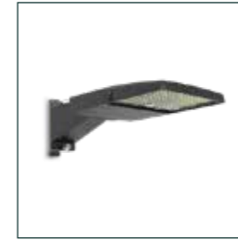
LP-STREET- AREA LIGHT 2 réf: EP150ARL16060W

Un éclairage clair et rassurant pour faciliter les déplacements en fin de journée. Il renforce la sécurité tout en restant économe en énergie.