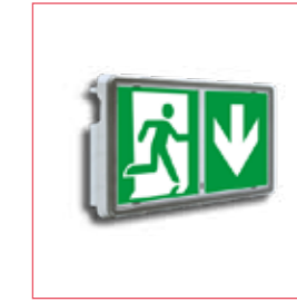
BLOC TECH EMERGENCY réf: BTONEE1S65DUOBE