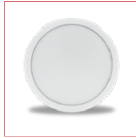
KAMELEON réf: HUB22KAM01CCT