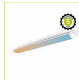
SURFACE LED CLASS ROOM réf: 100911