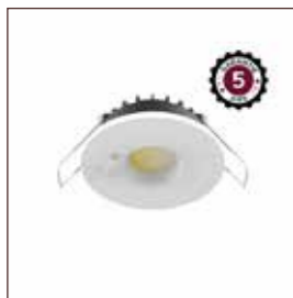
SPOT DOWNLIGHT ESA réf: 100619

Éclairage uniforme et discret pour un espace propre et sûr. Détection automatique pour plus d'hygiène et d'économies.